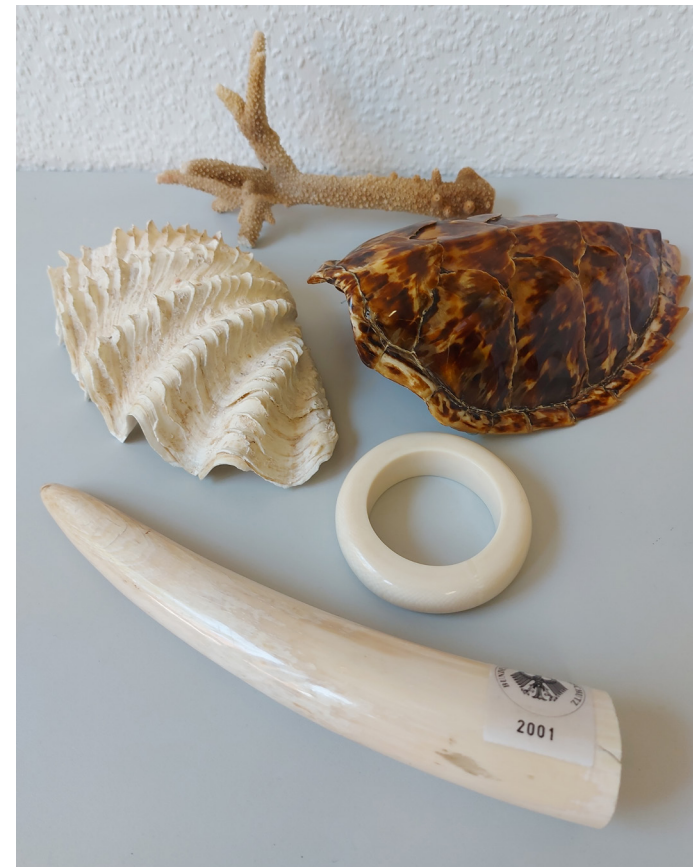
Abbildung 4: Teile von geschützten Tieren

Bei „Urlaubsmitbringseln“ ist zu beachten, dass nur amtliche Bescheinigungen von Behörden des Urlaublandes als Legalitätsnachweis gültig sind und mit diesen Bescheinigungen die Einfuhrgenehmigungen vor der eigentlichen Einfuhr zu beantragen sind. Ohne die Einfuhrgenehmigung droht eine Beschlagnahme durch den Zoll und die Ahndung des Einfuhr- bzw. Ausfuhrvergehens durch empfindliche Geldbußen.