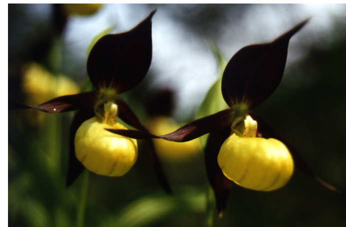
Abbildung 10: Frauenschuh- Orchidee – Streng geschützte Art des Anhangs A der EG- Verordnung Nr. 338/97

Bei künstlich erzeugten Farb- und Formvarietäten sowie bei nicht natürlich vorkommenden Hybriden ist von einer künstlichen Vermehrung auszugehen. Für diese und für die in einer beim CITES-Büro erhältlichen „Unbedenklichkeitsliste“ aufgeführten Pflanzen kann auf eine Nachweisführung verzichtet werden.