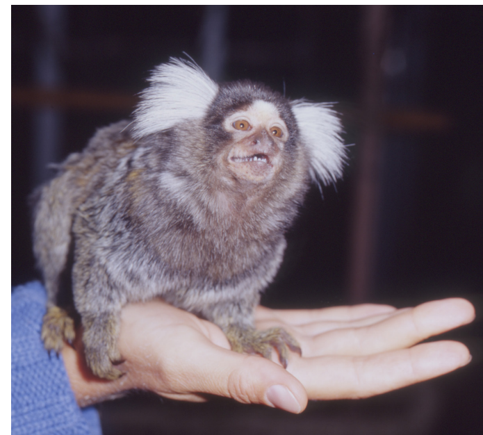
Abbildung 2: Weißbüscheläffchen – Besonders geschützte Art des Anhangs B der EG-Verordnung Nr. 338/97