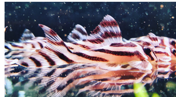
Abbildung 8: Zebrawels – Besonders geschützte Art des Anhangs B der EG-Verordnung Nr. 338/97

Bei allen seltenen Tieren sowie bei allen offen bringenden, transponderten und nicht gekennzeichneten Tieren ist der Weg, den das Tier vom Importeur bzw. Züchter bis zum gegenwärtigen Besitzer genommen hat, lückenlos zu belegen.