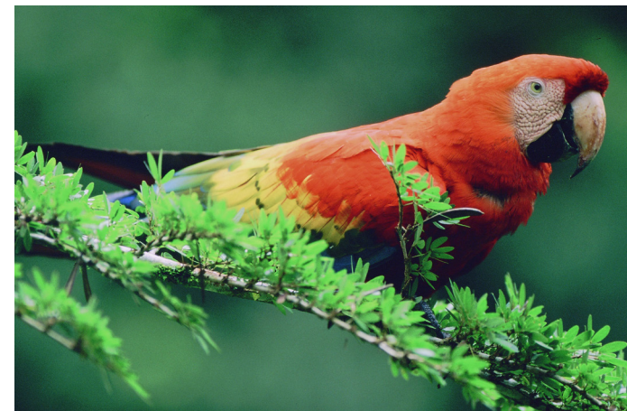
Abbildung 6: Hellroter Ara – Streng geschützte Art des Anhangs A der EG-Verord- nung Nr. 338 /97

Diese gelben EU-Bescheinigungen begleiten das jeweilige Exemplar bei jedem Weiterverkauf. Wenn nur eine einmalige Vermarktung genehmigt wurde, ist eine Neubeantragung vor jedem Verkauf erforderlich. Für die nur bis 1997 gültigen blauen CITES-Bescheinigungen müssen neue gelbe EU-Bescheinigungen beantragt werden.