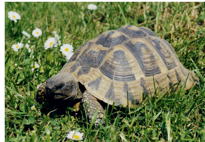
Abbildung 5: Griechische Landschildkröte – Streng geschützte Art des Anhangs A der EG-Verordnung Nr. 338/97

Vergehen gegen diese gesetzlichen Anforderungen stellen Ordnungswidrigkeiten dar, die mit Bußgeldern geahndet werden können.