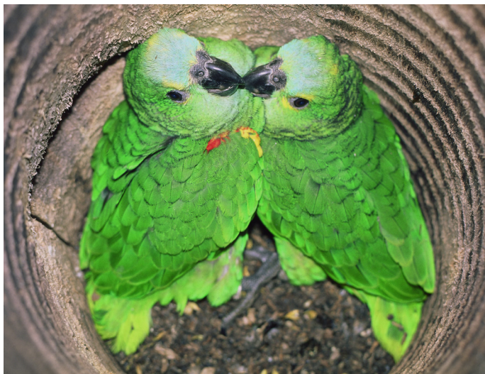
Abbildung 3: Blaustirnamazonen – Besonders geschützte Art des Anhangs B der EG-Verordnung Nr. 338/97

Alle geschützten Arten unterliegen strengen Verboten.