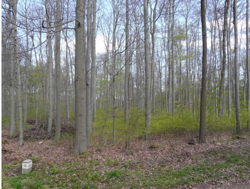
Foto 01 LRT 9130: Mittelalter, wüchsiger 90jähriger Waldmeister-Buchenwald in Abteilung 64 b1 (T. KATHÖVER)