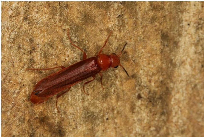
Foto 16 | Sägehörniger Werftkäfer ( Hylecoetus dermestoides )