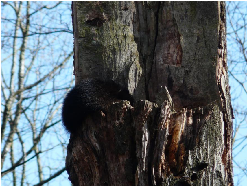
Foto 24 Der Waschbär als Neozoon hat sich im Hakel stark ausgebreitet. Dieses sehr dunkle Individuum hat seinen Tageseinstand auf einem über 10 m hohen Altbuchenstumpf.