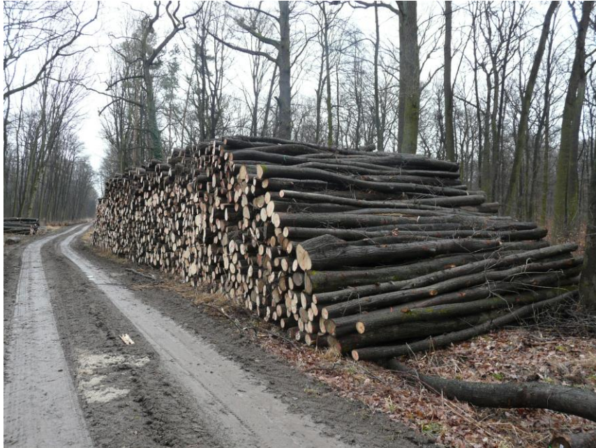
Foto 23 Große, homogene Sortimentspolter der Linde zeigen deutlich die starke Nutzung auch in der 2. Baumschicht.