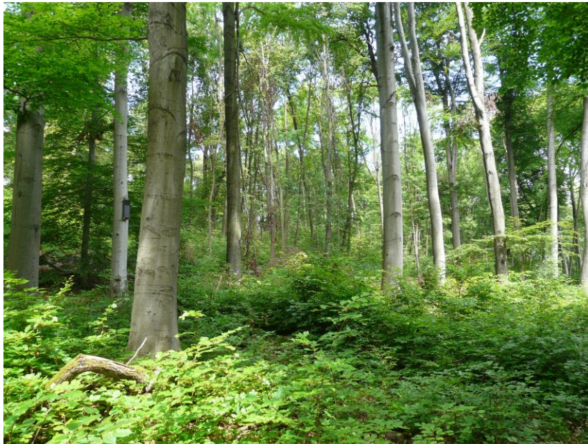
Foto 02 LRT 9130: Aufgelichteter, verjüngter 165jähriger Waldmeister-Buchenwald in Abtl. 62 a1