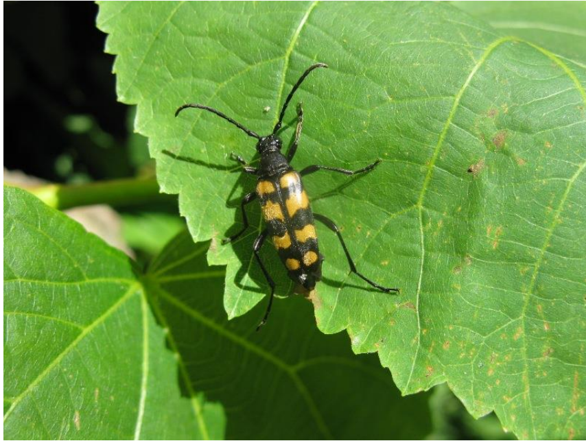
Foto 17 Vierbindiger Schmalbock ( Leptura quadrifasciata )