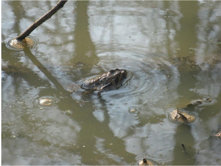
Foto 15 | Grasfrosch ( Rana temporaria ) verpaart, an Gewässer Nr. 4