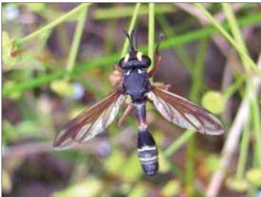
Dickkopffliege Physocephala rufipes . Wathlingen, 3.8.2011, Foto: R. Gerken.

Einen wichtigen Beitrag zur Erfassung der Conopidenfauna Sachsen-Anhalts leisteten bereits einige Entomologen, die Ende des 19. und Anfang des 20. Jahrhunderts Daten publizierten (JÄNNER 1937, KLEINE 1909, LASSMANN 1934, LOEW 1857) und weitere, wie z. B. MAERTENS und RIEDEL, die an der Erstellung der Monographie über die Fliegen Thüringens (RAPP 1942) beteiligt waren. Insgesamt sieben Arten, die in der damaligen Zeit belegt wurden, müssen gegenwärtig in Sachsen-Anhalt als ausgestorben oder zumindest verschollen eingestuft werden. Das ältere Sammlungsmaterial aus Sachsen-Anhalt ist über zahlreiche Museen und