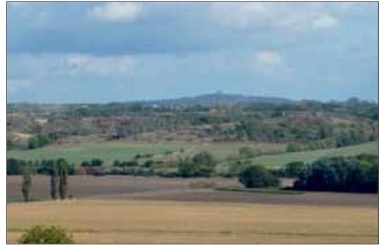
In der ausgedehnten „Porphyrykuppenlandschaft nordwestlich von Halle“ ist der 250 m hohe Petersberg mit der Stiftskirche weithin sichtbar. 7.10.2012