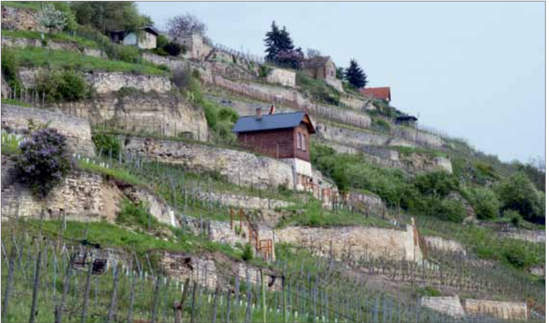
Die Weinberge im Unstruttal bei Freyburg zeugen von einer langen Nutzungsgeschichte. Diese traditionell genutzte Kulturlandschaft ist gleichzeitig Lebensraum für viele spezifisch angepasste Arten. 10.5.2013