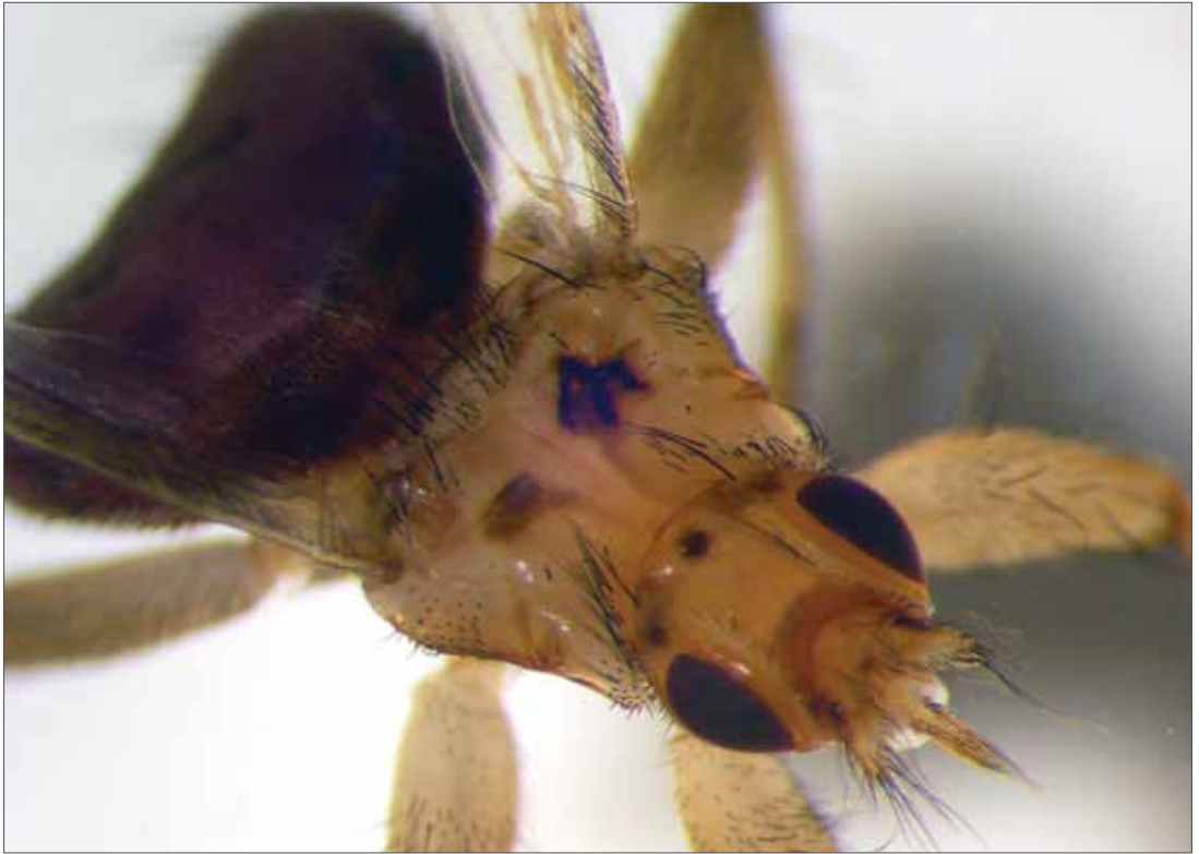
Sichelflügel-Schwalbenlausfliege ( Stenopteryx hirundinis). 31.8.2008