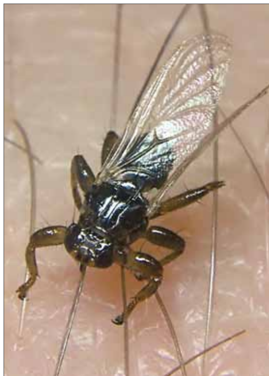
Hirschlausfliege ( Lipoptena cervi ). Dobbin-Linstow, Forst Barkhorst, Juni 2004.

Für Sachsen-Anhalt liegen publizierte Nachweise von zehn Arten vor (MÜLLER 1997, REDLICH et al. 2006, JENTZSCH 2010, JENTZSCH & SCHULZE 2013). Ein Groß-