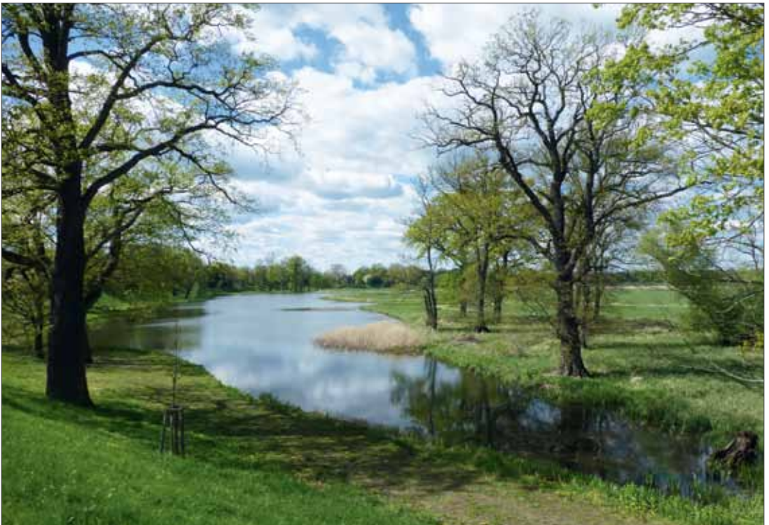
Das Wörlitzer Gartenreich ist eine ausgedehnte Kulturlandschaft in den Elbeauen östlich von Dessau. Auch außerhalb der eigentlichen Gartenanlagen (hinter dem Deich am linken Bildrand) wurde die nachhaltige Bewirtschaftung des Grünlands der Aue, beispielsweise durch kontinuierliche Pflanzung und Pflege einzelner Bäume (in der Regel Eichen), sichergestellt. 16.4.2014