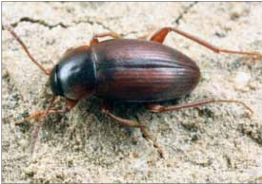
Choleva agilis ist eurytop bei Kleinsäufern und an Faulstoffen. Größe ca. 4 mm, Köln, 20.5.2009