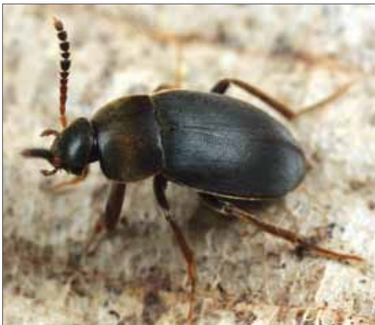
Catops longulus lebt in Wäldern in Tierbauten. Größe ca. 4 mm, Betrange (LU), 20.10.2008