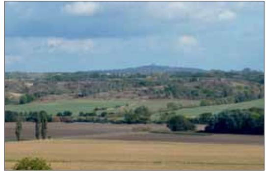
In der ausgedehnten „Porphyrkuppenlandschaft nordwestlich von Halle“ ist der 250 m hohe Petersberg mit der Stiftskirche weithin sichtbar. 7.10.2012