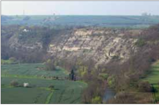
Im mittleren Saaletal hat sich der Fluss tief in die Muschelkalk-Schichten des Thüringer Beckens eingeschnitten. FFH-Schutzgebiet „Himmelreich bei Bad Kösen“, 11.4.2009