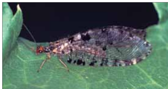
Europäischer Bachhaft ( Osmylus fulvicephalus ). Schiello, 1989, Foto: A. Stark.