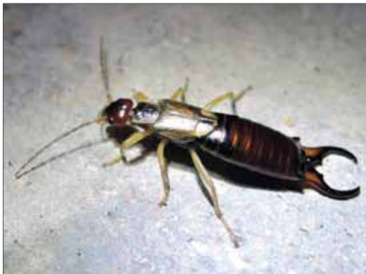
Männchen des Gemeinen Ohrwurms ( Forficula auricularia). Halle, 30.11.2014