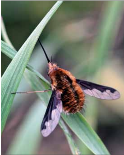
Wollschweber Bombylius major . Mansfelder Seen, 1.5.2013, Foto: A. Zimmermann.

den, dass z. B. Thyridanthrax fenestratus (FALLEN, 1814) nicht in der derzeitigen Liste erscheint, obwohl diese Art in benachbarten Bundesländern kurz hinter der Grenze schon mehrfach nachgewiesen wurde (z. B. Thüringen, Kyffhäuser, Coll. BURGER; Mecklenburg-Vorpommern, Retzow, Coll. LANGE). Wahrscheinlich ist auch, dass einige der derzeit als ausgestorben eingestuft Arten in den nächsten Jahren wieder belegt werden können.