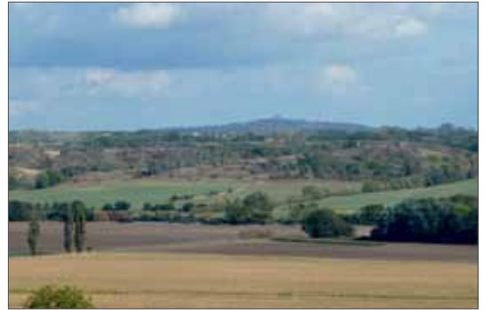
In der ausgedehnten „Porphyrykuppenlandschaft nordwestlich von Halle“ ist der 250 m hohe Petersberg mit der Stiftskirche weithin sichtbar. 7.10.2012