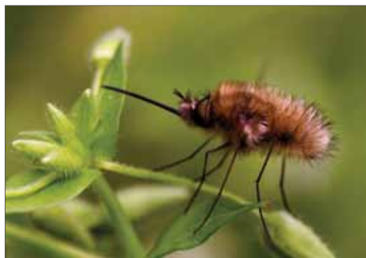
Wollschweber Bombylius venosus. Altenburg, 20.4.2014

Sachsen-Anhalt besitzt eine große Anzahl an Landschaftsräumen, die ausgesprochen geeignete Lebensräume für Wollschweber bieten. Vor allem die zahlreichen xerothermen Biotope, die auch als Lebensräume für Hymenopteren, den häufigsten Wirten der Bombyliidae, geeignet sind, werden von Wollschweben bevorzugt. Zusätzlich sind die klimatischen Verhältnisse des mitteldeutschen Trockengebiets als optimal zu bezeichnen, sodass mit weiteren Arten zu rechnen ist. Dem mangelhaften Erforschungsgrad der Wollschweberfauna Sachsen-Anhalts, vor allem des aktuellen Bestandes, ist es zu schul-