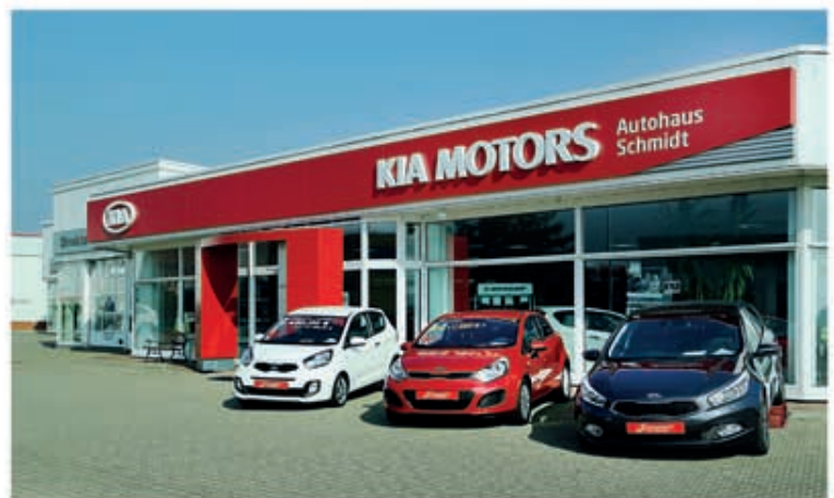
Freut sich auf Ihren Besuch: das Team von Kia Vertragspartner.