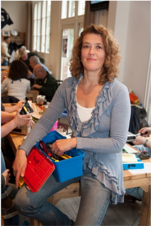
Martine Postma Gründerin des 1. Repair Cafés 2009 in Amsterdam