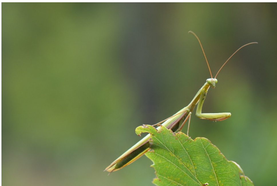
Foto: Männliche Gottesanbeterin, aufgenommen 2020 in der Gemeinde Südharz. Verwendung des Fotos mit Angabe der Fotografin Sandra Dullau