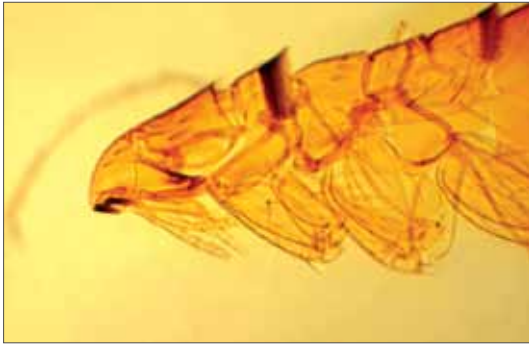
Fledermausfloh Nycteridopsylla pentactena : Kopf und Thorax des Männchens. Karritz/Altmark, 7.3.1987, beide Fotos: J. Müller.