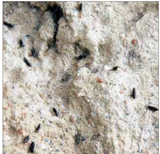
Uferschwalbenflöhe ( Ceratothylus styx ) im Frühjahr an der Steilwand vorjähriger Brutröhren in Erwartung der Uferschwalben ( Riparia riparia ). Atzendorf, Marbe-Kiesgrube, 7.5.2009, Foto: J. Müller.

Das hier vorgelegte erste sachsen-anhaltische Verzeichnis der Flöhe ist nicht nur im Rahmen der Biodiversitäts-Erfassung von Interesse, sondern insbesondere auch für die Human- bzw. Tiermedizin aus parasitologischer und hygienischer Sicht von besonderer ökologischer/epidemiologischer Bedeutung (TRAUB et al. 1983, MÜLLER 1990, WALTER 2004). Keine der Floharten ist besonders gesetzlich geschützt.