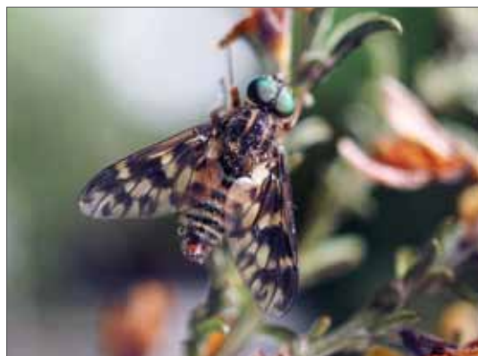
Ibisfliege Atherix ibis . Boxberg.