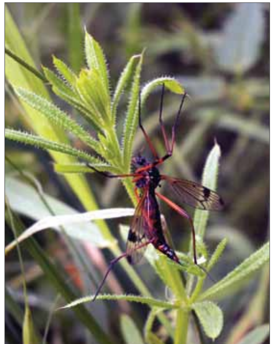
Kammschnake Ctenophora pectinicornis auf Kleb-Labkraut. Wallenhorst, 2.6.2005