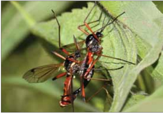
Schwarze Kammschnaken ( Tanyptera atrata) bei der Kopulation. Gut sichtbar sind die kammförmigen Fühler des Männchens. Wallenhorst, 24.6.2008