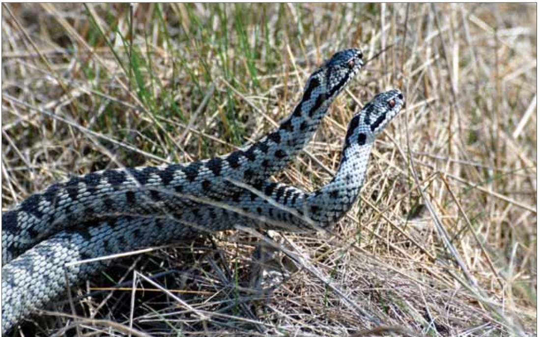
Die Kreuzotter ( Vipera berus ) gehört in Sachsen-Anhalt derzeit zu den am stärksten gefährdeten Kriechtierarten, zwei Männchen im Kommentkampf. Pöllwitzer Wald bei Greiz, 2015, Foto: T. Sy.

Der Prädationsaspekt scheint sich – zumindest regional – auch auf den Bestandstrend der Schlingnatter ( Coronella austriaca ) auszuwirken. Im Unterharz und Harzvorland konnten zahlreiche Altnachweise nicht wiederbestätigt werden, wohingegen mehrfach angebissene Individuen gefunden werden (PROF. HELLRIEGEL-INSTITUT e.V. & RANA 2012a). Auch im Süden Sachsen-Anhalts, beispielsweise im Zeitzer Raum, waren zahlreiche Wiederholungskartierungen an belegten Altfundorten erfolglos und führten nicht zur Bestätigung (RANA & PROF. HELLRIEGEL-INSTITUT e.V. 2011). Neufunde in verschiedenen Landesteilen, teilweise auch in Nachbarschaft zu bekannten Fundorten, können hingegen nicht als Ausbreitung der Art, sondern vielmehr als Ergebnis verstärkter Kartieraktivitäten gedeutet werden. So wurden in der nordwestlichen Altmark Nachweislücken geschlossen (KNAPP 2011), wo von einer zerstreuten Verbreitung der Art in den geeigneten Lebensräumen, wahrscheinlich überwiegend auf geringem Populationsniveau, ausgegangen werden kann. Generell spricht jedoch die recht hohe Zahl nicht geglückter Wiederbestätigungen für einen insgesamt rückläufigen Bestandstrend.