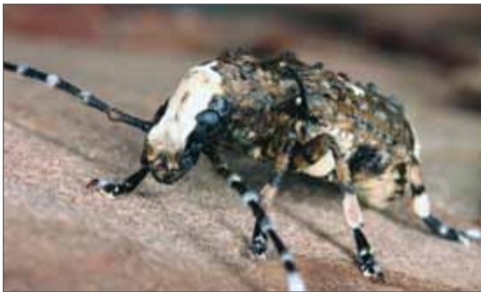
Der große Breitmaulrüssler, Platystomos albinus, lebt auf Waldlichtungen und an Waldrändern. Er ernährt sich von Baumpilzen. Dobratsch (AT), 19.9.2012