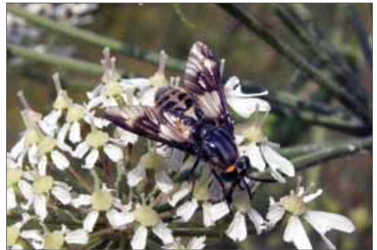
Weibchen der Goldaugenbremse Chrysops relictus .