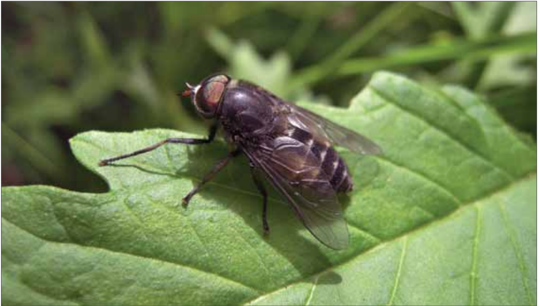
Hybomitra bimaculata (Männchen). Wilhelmsthal, 16.6.2013