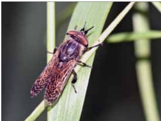
Männchen der Regenbremse Haematopota pluvialis .

Insgesamt konnten für Sachsen-Anhalt aktuell nur 27 Arten nach 2000 festgestellt werden (47 % des deutschlandweiten Artenbestandes), darunter mit Haematopota scutellata und Chrysops divaricatus zwei für das Bundesland bisher nicht erwähnte Spezies (BÄSE 2011, 2015b). Für Hybomitra lurida und Tabanus quatuornotatus gelangen seit RAPP (1942), für Hybomitra aterrima var. auripila seit 1956 (BÄSE 2013), für Haematopota crassicornis , Hybomitra tropica und Tabanus glaucopsis seit JEREMIES (1982) und für Atylotus rusticus , Tabanus bromius und Tabanus maculicornis seit VÖLLGER (1983, 1984) aktuelle Nachweise. Aufgrund des noch mangelhaften Erfassungsstandes ist eine Häufigkeitseinschätzung für die meisten Arten derzeit nur ungefähr möglich. Als jüngere Veröffentlichungen sind nur AK DIPTERA (2006), BÄSE (2011, 2013, 2015a, b) und JENTZSCH & STEINBORN (2007) zu nennen. Viele Arten, die mit „A“ bewertet wurden, sind vermutlich eher als verschollen, denn als ausgestorben zu betrachten und es ist künftig mit Wiederfinden zu rechnen. Die mit Abstand häufigsten Spezies sind nach derzeitigem Kenntnisstand Chrysops relictus , Haematopota pluvialis und Tabanus bromius . Die Nomenklatur orientiert sich an SCHACHT (1999). Keine der Bremsenarten unterliegt besonderem gesetzlichem Schutz.