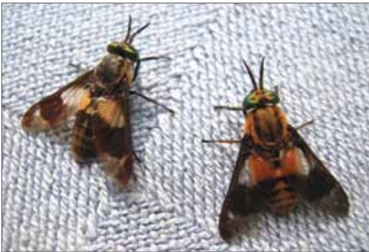
Die Bremsenarten Chrysops caecutiens (Weibchen, links) und C. viduatus (Weibchen, rechts). Dobien bei Wittenberg, 18.6.2012