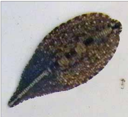
Schildkrötenegel Placobdella costata .

Die Nomenklatur folgt NESEMANN & NEUBERT (1999).