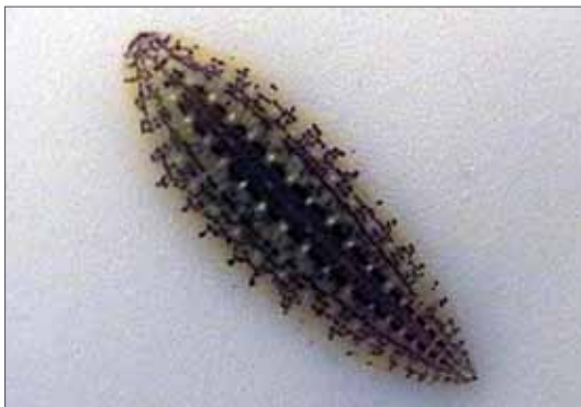
Großer Schneckenegel ( Glossiphonia complanata ).

Erfreulich ist das regelmäßige Auftreten des in Mitteleuropa seltenen Schildkrötenegels ( Placobdella costata ) in individuenreichen Populationen an der mittleren Elbe (Region um Dessau-Wörlitz). Das Auftreten dieser Art wurde auch in den vergangenen Jahrzehnten beachtet und publiziert, sodass zunehmende Fundmeldungen