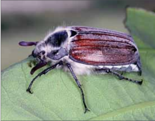
Waldmaikäfer ( Melolontha hippocastani). Colbitz-Letzlinger Heide, 16.5.2014