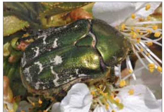
Variabler Goldkäfer ( Protaetia cuprea metallica ). Münchenberg bei Neinstedt, Mai 2008, Foto: G. Schumann.

Das Territorium Sachsen-Anhalts bietet mit der in seinen naturräumlichen Haupteinheiten gelegenen Habitatmannigfaltigkeit eine, im Vergleich zu anderen Bundesländern, besonders große Vielfalt. So sind für den Norden im Gebiet des Stendaler Landes einzelne Moore und Hangrestwälder bedeutsam, für die Elbtalniederung sind es die Auwaldbestockungen mit verlandeten und abgeschnittenen Flussschlingen. Im Östlichen Harzvorland und in der Börde beeindruckend die Felsfluren des Saaledurchbruchs bei Könnern oder die xerothermen Magerrasen am Süßen See und Standortsonderformen wie einzelne Salzstellen und natürlich der Harz mit seinen verschiedenen Waldbiozöten im Übergang von kollinen zu submontanen Lagen. Ebenso bemerkenswert ist der dem Harz vorgelagerte Südharzer Zechsteingürtel des Thüringer Beckens und seiner Randplatten. Darüber hinaus wird dieses Bild durch die Trockentäler des Unteren und Mittleren Muschelkalks zwischen Saale und Unstrut weiter ergänzt. Dort liegt auch das reliktarartige Vorkommen von Sisyphus schaefferi , einer wärme- und trockenheitsliebenden Art, die sonnige Abhänge und trockene Weideplätze mit Steppencharakter bevorzugt. Im Rahmen ihres paläarktischen und orientalischen Verbreitungsgebietes erreicht sie nur die südlichen, wärmeren Teile Deutschlands und hat wahrscheinlich bei uns ihre nördlichste Verbreitungsgrenze. Aus dem gleichen Gebiet liegt auch ein Nachweis von Ochodaeus chrysomeloides durch JUNG