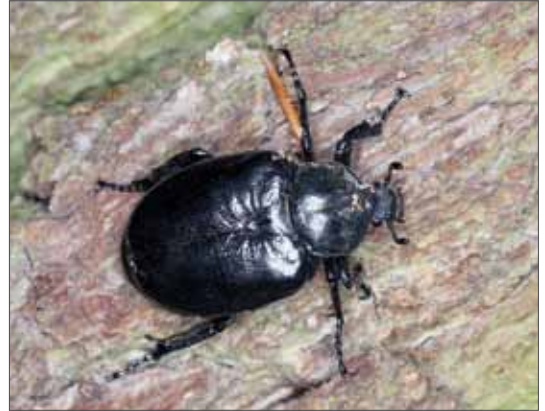
Eremit ( Osmoderma eremita). Altengrabow, 28.7.2011