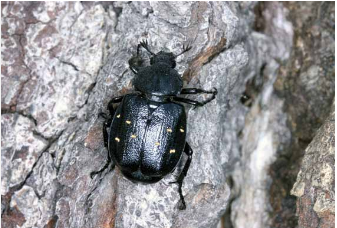
Der Schwarze Edelkäfer ( Gnorimus variabilis) besiedelt Baumhöhlen mit Mulm, hier auf einer Eiche in der Colbitz-Letzlinger Heide. 12.6.2014