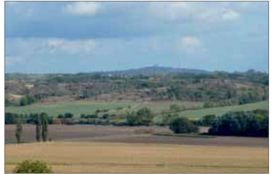
In der ausgedehnten „Porphyryknippenlandschaft nordwestlich von Halle“ ist der 250 m hohe Petersberg mit der Stiftskirche weithin sichtbar. 7.10.2012