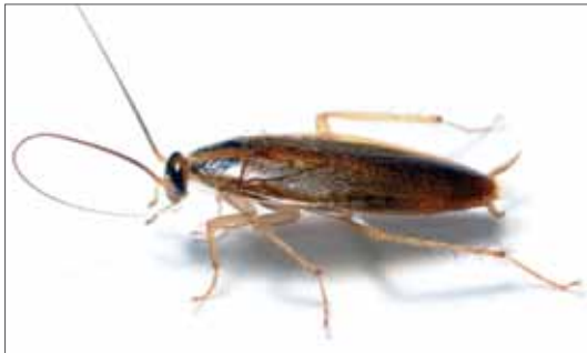
Deutsche Schabe ( Blattella germanica ) - die in Sachsen-Anhalt am weitesten verbreitete synanthrope Schabenart.

Die Fangschrecken sind recht eng mit den Schaben verwandt, wie sich am besten an den ähnlich gebauten Eipaketen erkennen lässt. Deshalb werden beide Taxa