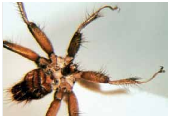
Penicillidia monoceros (Länge etwa 3,5–4 mm) von Myotis daubentoni . Rübeland-Neuwerk, 2.3.1982, Foto: J. Müller.

Neben den bisher vier für Sachsen-Anhalt sicher nachgewiesenen Nycteribiiden-Arten (44% der in Deutschland nachgewiesenen Arten) sind auch folgende, bereits im benachbarten Thüringen nachgewiesene, zu erwarten: Phthiridium biarticulatum HERMANN, 1804, spezifisch für Hufeisennasen, (Nachweise 2000, 2002 nach HEDDERGOTT 2003, HEDDERGOTT & KOCK 2003); Nycteribia vexata WESTWOOD, 1834, spezifisch für Myotis myotis , (Nachweis 2000 nach HEDDERGOTT & KOCK 2003) und Basilisa mongolensis nudior HURKA, 1972 auf der erst neu beschriebenen und für Deutschland erstmals im Jahre 2005 nachgewiesenen Nymphenfledermaus Myotis alcaethoe HELVERSEN & HELLER, 2001 (HEDDERGOTT 2008).