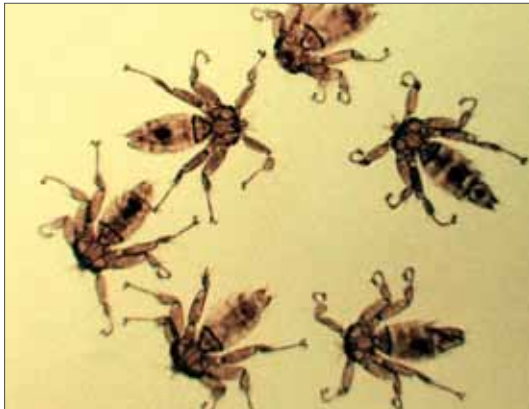
Nycteribia kolenatii (Länge jeweils etwa 2,2 mm) von Myotis daubentonii . Rübeldand-Neuwerk, Präparat in Kanadabalsam. 2.3.1982, Foto: J. Müller.

Nomenklatorisch wird der deutschen Nycteribiiden-Checkliste (MÜLLER 1999) nach HURKA & SOOS (1986) gefolgt.