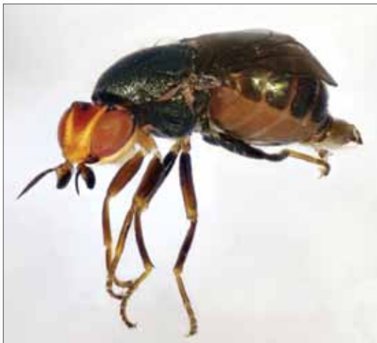
Camarota curvipennis . Halle Stadtgebiet

Seit der Publikation der Roten Liste (WENDT 2004) haben sich bei mehreren Spezies neue Erkenntnisse zum Gefährdungsgrad ergeben. 2006 wurden z. B. Eu-