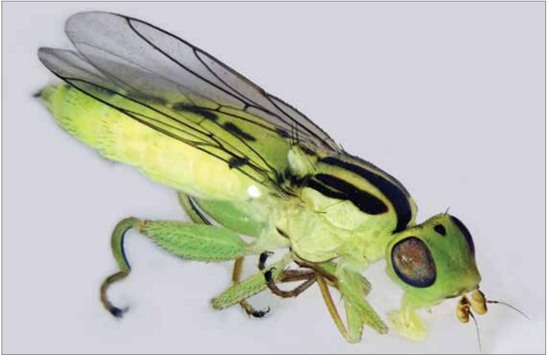
Halmfliege Meromyza spec. Saalberghau bei Dessau, Foto A. Stark.

rina lurida und Incertella nigrifrons in mehreren Exemplaren am ehemaligen Salzigen See gefangen. Außerdem stellten sich vier Arten als Fehldeterminationen heraus, ihr Vorkommen in Sachsen-Anhalt ist noch nicht durch Funde belegt ( Aphanotrigonum inerme COLLIN, 1946; Chlorops fasciatus MEIGEN, 1830; Chlorops infumatus (BECKER, 1910); Rhopalopterum fasciolium (MEIGEN, 1830).