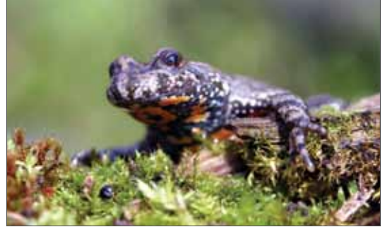
Für die in Sachsen-Anhalt stark gefährdete Rotbauchunke ( Bombina bombina ) sind dringend weitere Maßnahmen des Artenhilfsprogrammes umzusetzen. Gohrischheide (SN), 2009, Foto: M. Schulze.