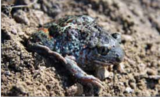
Die Knoblauchkröte ( Pelobates fuscus ) ist in Sachsen-Anhalt noch relativ weit verbreitet. Geiselatal (Innenkippe), 2010, Foto: M. Schulze.

Mitteleuropa weit verbreitet und auf vielen Amphibien nachweisbar. Anders als in Amerika, Australien oder Spanien sind aus Deutschland jedoch bislang keine durch Bd verursachten Bestandseinbrüche oder Rückgänge von Amphibien bekannt geworden (OHST et al. 2011, BÖLL et al. 2014).