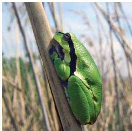
Der Laubfrosch ( Hyla arborea ) zeigt in Sachsen-Anhalt regional eine Ausbreitungstendenz, landesweit lässt sich jedoch keine generelle Zunahme konstatieren. Elster-Luppe-Aue, 2005, Foto: T. Sy.

Für den Kammolch ( Triturus cristatus ) zeichnet sich in den meisten Schwerpunktgebieten ein mehr oder weniger stabiles Verbreitungsbild ab. Regional halten sich Neunachweise und erloschene Vorkommen in etwa die Waage, wobei ein Großteil der Neufunde auf die im Vergleich zu früheren Erhebungen wesentlich effizienteren Erfassungsmethoden mittels Licht- und Reusenfallen und weniger auf aktive Ausbreitungsprozesse zurückzuführen sein dürfte. Lokal sind aber auch stärkere Bestandseinbrüche zu verzeichnen, wie z. B. am Nordharzrand, wo