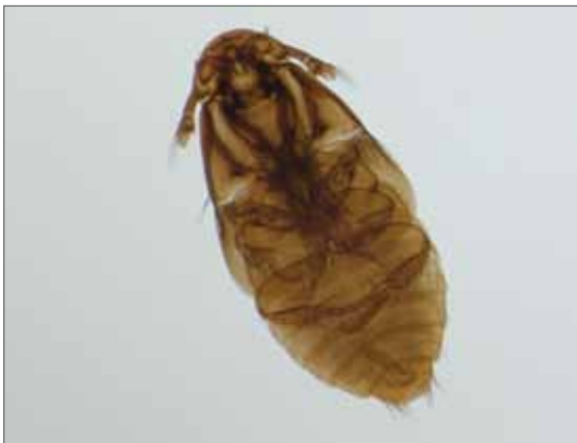
Biberkäfer ( Platypssyllus castoris ), Ventralansicht. Bemerkenswert sind die gelbbraune Färbung aufgrund Depigmentierung und die starke Beborstung.

Platypssyllus castoris und Leptinus testaceus sind morphologisch vollkommen unterschiedlich. Bei dem dorsiventral abgeplatteten P. castoris fällt es schwer, einen Käfer („Biberlaus“) zu erkennen (NEUMANN 1993). Trotzdem werden in Arbeiten der neueren Systematik die Familien der Leptinidae und Platypsyllidae zur Familie der Leptinidae zusammengefasst (u. a. FREUDE 1971, KÖHLER & KLAUSNITZER 1998). Der Grund der Zusammenlegung scheint nach FREUDE (1971) in der Angabe RILEYS zu liegen, dass die amerikanische Art Leptinillus validus HORN, 1872 einmal mit P. castoris gemeinsam in Biberfellen gefunden wurde. FREUDE (1971) äußert