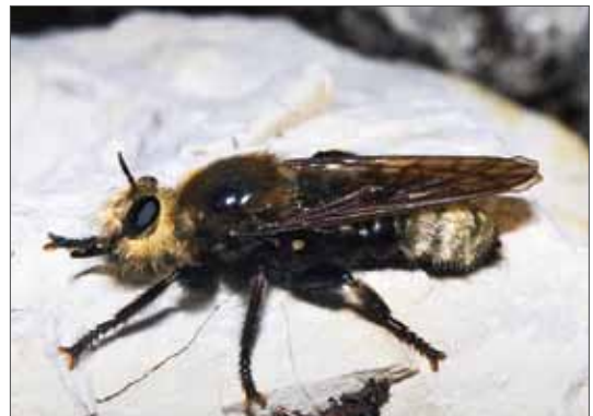
Die in Deutschland stark gefährdete Große Mordfliege ( Laphria gibbosa ) ist seit über 60 Jahren nicht mehr in Sachsen-Anhalt beobachtet worden. Trögerner Klamm (AT), 7.9.1999.

In der Tabelle (Spalte „Letzter Nachweis“) ist der letzte veröffentlichte Nachweis mitgeteilt. Bei knapp einem Fünftel der Arten liegt er mehr als 25 Jahre zurück. Aktuelle Funde dieser Arten sind von besonderem Interesse. Die Aufsätze, in denen die einzelnen Arten für Sachsen-Anhalt gemeldet wurden, sind in der Spalte „Nachweis“ genannt. Die Nummernangaben entsprechen den Endnummern der Literaturzitate im Literaturverzeichnis, in dem alle Aufsätze und Arbeiten vor Februar 2012 mit Fundmeldungen aus Sachsen-Anhalt aufgelistet sind, unabhängig davon, ob es sich um Originalmeldungen oder um Zitate handelt. Auf der Internet-Website www.asilidae.de sind diese Daten zum einen im Detail abrufbar und zum anderen grafisch zu Nachweiskarten, Flugzeitdiagrammen etc. aufbereitet.