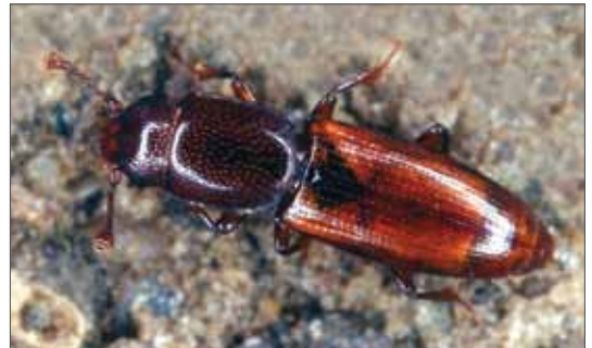
Rhizophagus perforatus ist oft unter saftfrischen Rinden zu finden. Größe ca. 3 mm, Bornheim-Waldorf (NW), 6.5.2013, Foto: F. Köhler.