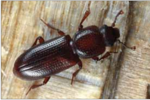
Rhizophagus cribratus ist etwa 3 mm groß und lebt unter morschen Rinden und im Mulm. Edertal (HE), 15.7.2008