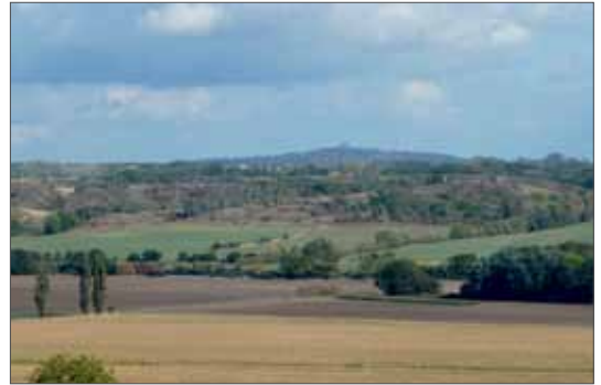
In der ausgedehnten „Porphyrkuppenlandschaft nordwestlich von Halle“ ist der 250 m hohe Petersberg mit der Stiftskirche weithin sichtbar. 7.10.2012