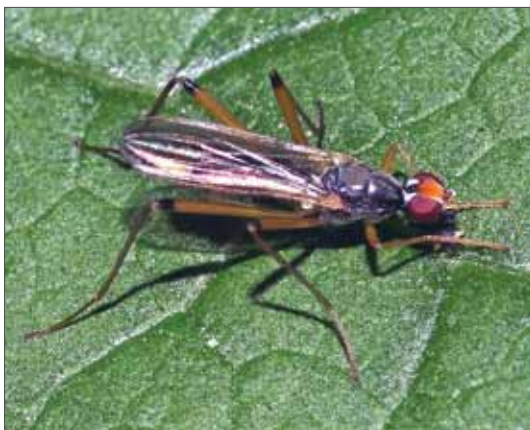
Männchen der Stelfliege Neria cibaria . Schielo im Harz, Juni 2014, Foto: A. Stark.

Es gab relativ häufig Änderungen der Gattungsnamen, was auch in der Einklammerung der Namen der Erstbeschreiber bei den meisten Arten zum Ausdruck kommt. Die Gattung Neria wurde zergliedert und wieder zusammengeführt. Die ehemals gültigen, in der Spalte „Synonyme“ aufgeführten, Gattungsnamen werden von manchen Autoren als Untergattungen angesehen.