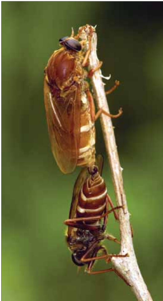
Stinkfliege Coenomyia ferruginea . Westlich Oberhaching, 6.6.2008.

Weltweit umfasst die Familie der Coenomyidae nur 23 Arten und in Deutschland ist davon lediglich Coenomyia ferruginea vertreten (SCHUMANN 1999). Es handelt sich um eine recht große und eher plumpe Dipterenart mit sylvicoler Lebensweise, die eher ungern und nur über kurze Strecken fliegt. Man findet sie in humusreichen Laubbeständen, aber auch in Nadelwäldern, wobei erstere eindeutig bevorzugt werden. Die Imagines verströmen einen eigentümlichen Geruch, der wiederholt mit Kräuterkäse verglichen wurde. Daraus resultiert der deutsche Name Stinkfliege. Wenngleich sich die Aussagen in der Fachliteratur vereinzelt widersprechen, so kann doch von