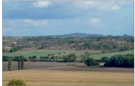
In der ausgedehnten „Porphyryknippenlandschaft nordwestlich von Halle“ ist der 250 m hohe Petersberg mit der Stiftskirche weithin sichtbar. 7.10.2012