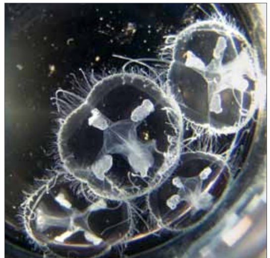
Medusen von Craspedacusta sowerbii aus dem Wehrstedter See bei Halberstadt. Hier wurden 1992 die ersten Süßwassermedu-sen in Sachsen-Anhalt gefunden.

Aus Sachsen-Anhalt sind elf Vorkommen gemeldet, die nach den bisherigen Erfahrungen für Deutschland nur einen Bruchteil der tatsächlichen Vorkommen dar-stellen. Hinsichtlich der hydrochemischen, limnologi-