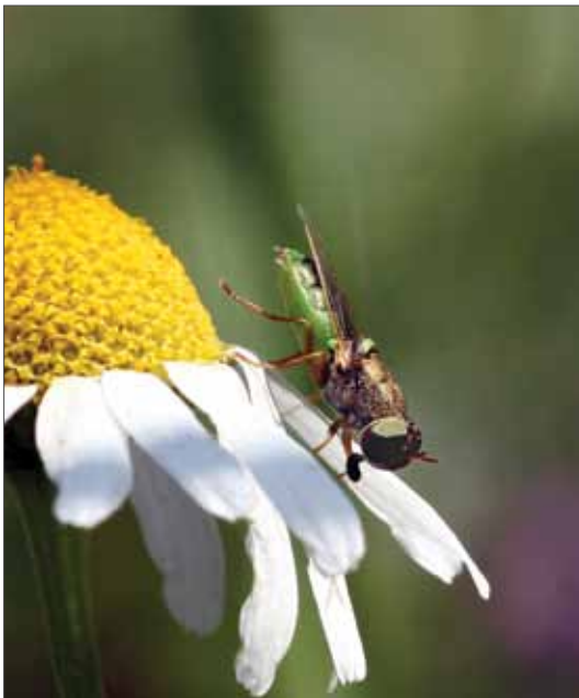
Waffenfleie Odontomyia angulata auf Strandkamille ( Tripleurospermum perforatum). Geiselniederung bei Zscherben, 16.7.2010