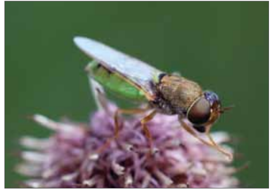
Waffenfleie Odontomyia angulata. Geiselniederung bei Zscherben, 16.7.2010