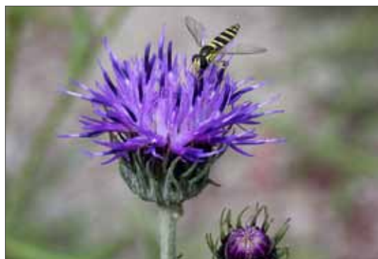
Die nicht nur in Sachsen-Anhalt sehr seltene Sand-Silberscharte ( Jurinea cyanoides) zählt zu den stark gefährdeten einheimischen Arten und steht unter strengem Schutz. Hier wird die Blüte der in einem Nachzuchtbeet stehenden Pflanze von einer Schwebfliege der Gattung Sphaerophoria aufgesucht. Bernburg, 16.7.2009