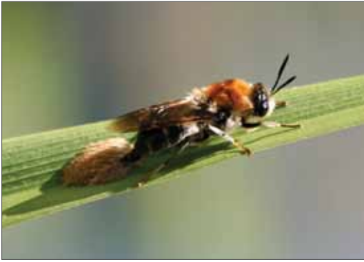
Waffenfleie Stratiomys longicornis bei der Eiablage an Igelkolben ( Sparganium erectum). Bad Lausick, 18.5.2007