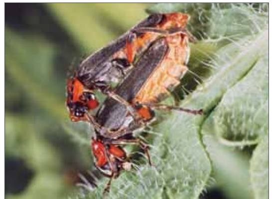
Cantharis rustica , eine häufige Weichkäfer-Art. Gera, 9.5.1984, Foto: D. Frank.

Bezogen auf die Familien gehören fünf Arten (davon zwei Rote-Liste-Arten) zu den Lycidae, eine Art (zugleich Rote-Liste-Art) zu den Omalidae, drei Arten zu den Lampyridae (davon eine Rote-Liste-Art), 63 Arten zu den Cantharidae (davon 29 Rote-Liste-Arten) und eine Art zu den Drilidae (Rote-Liste-Art). Acht Arten (11 %) sind häufig bis gemein, ebenfalls acht (11 %)