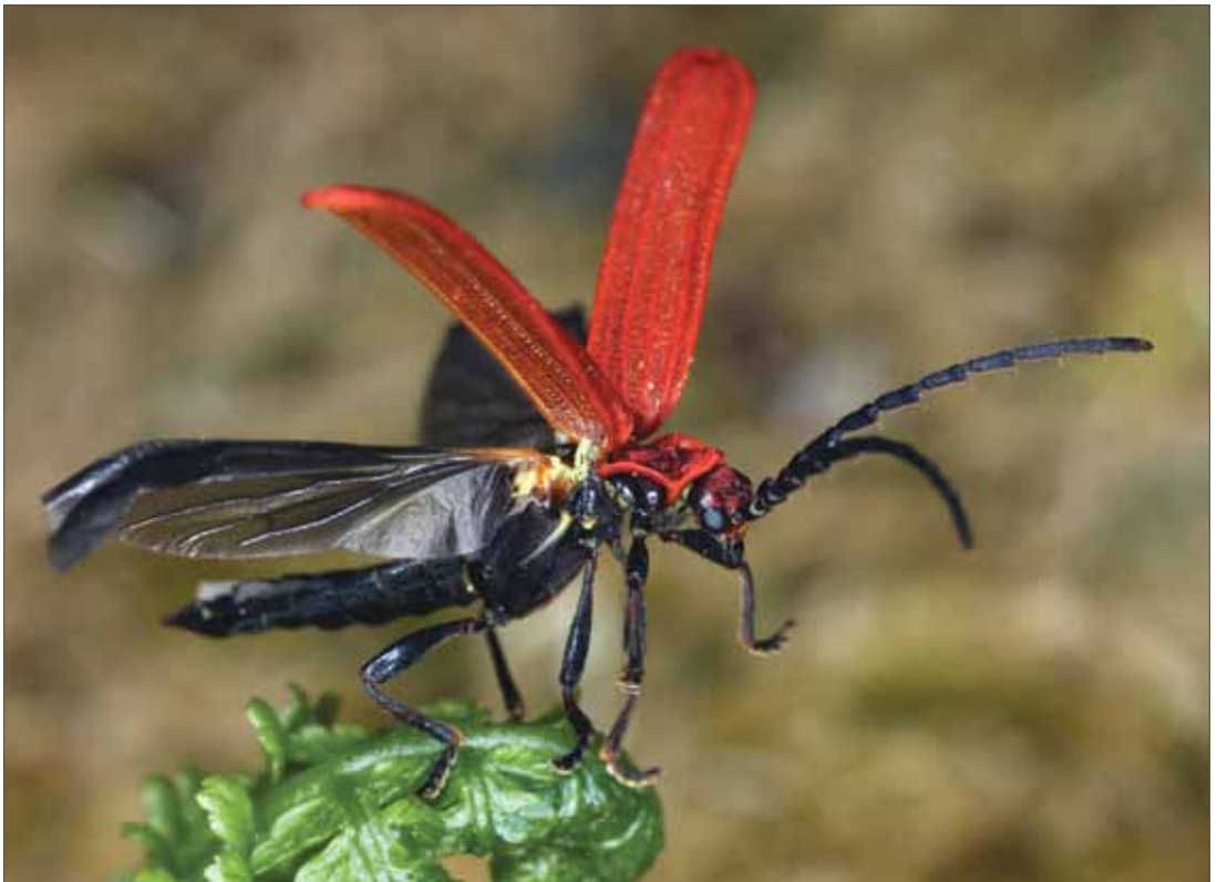
Scharlachroter Netzkäfer ( Dictyoapterus aurora). Maiernigg (AT), 13.4.2010