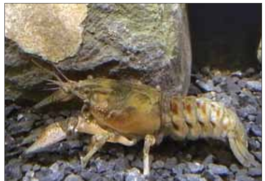
Kamberkrebs ( Orconectes limosus ). Aquariumaufnahme, 2013, Foto: W. Wendt.

Der Marmorkrebs ( Procambarus fallax f. virginalis ) ist als jüngstes allochthones Faunenelement in Sachsen-Anhalt erstmals im Jahr 2010 im Saalekreis durch Abwanderung aus einem Dorfteich bekannt geworden (WENDT 2010) und folgt hier einem europaweit zu beobachtenden Trend zur Ausbreitung (CHUCHOLL et al. 2012). Als weltweit einziger sich parthenogenetisch vermehrender zehnfüßiger Krebs besitzt der Marmorkrebs ein gewaltiges Vermehrungspotenzial. Die ursprünglich in der Aquaristik überwiegend als Futtertiere gehaltenen Marmorkrebse sind bereits im 1. Lebensjahr vermehrungsfähig (Edelkrebs ab 4., vereinzelt 3. Lebensjahr!) und können fortan in ca. achtwöchigem Intervall 40–250 unbefruchtete Eier produzieren, aus denen sich ab dem 4. Monat wiederum reproduzierende Weibchen entwickeln. Wie die anderen amerikanischen Flusskrebse kann auch der Marmorkrebs als Überträger des Krebspesteregens fungieren und stellt daher eine weitere Gefahr für die Restvorkommen des Edelkrebses dar. Trotz mehrjähriger Bemühungen konnte die Pionierbesiedlung im Saalekreis bislang nicht gänzlich ausgerottet werden (WENDT 2013). Eine weitere Ausbreitung ist allerdings auch nicht erfolgt. Die nähere Zukunft wird zeigen, ob die eingeleitete biologische Bekämpfung durch Aalbesatz allein zur Ausrottung der Marmorkrebse führen kann oder schlussendlich doch noch Maßnahmen mit einem rechtlich nicht unumstrittenen Chemikalieneinsatz ergriffen werden müssen.