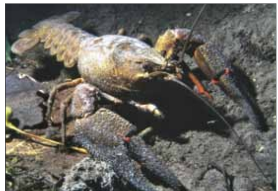
Edelkrebs ( Astacus astacus ) auf nächtlicher Nahrungssuche in einem natürlichen Fließgewässer. 1996, Foto: S. Ellermann.