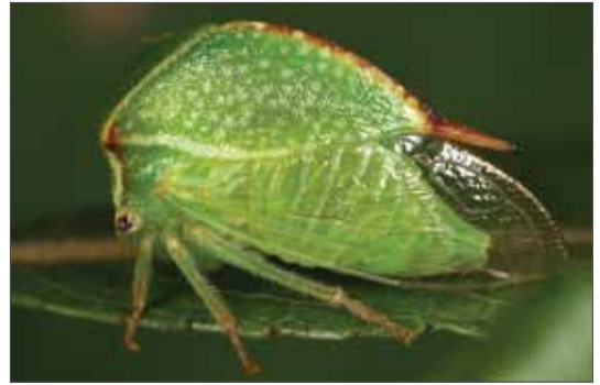
Die aus Nordamerika stammende Büffelzikade ( Stictocephala bisonia ) wurde erstmals im Jahre 2007 in Sachsen-Anhalt festgestellt.