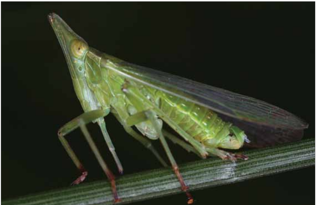
Der Europäische Laternenträger ( Dictyophara europaea ) bevorzugt warme Staudenfluren.