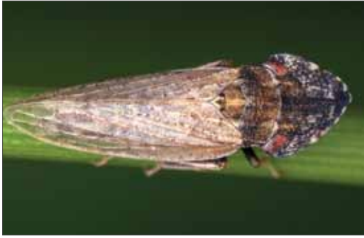
Die Löffelzikade ( Eupelix cuspidata ) ist ein Bewohner von Halbtrocken- und Trockenrasen.