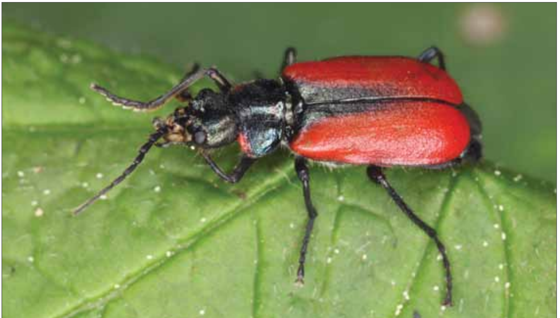
Malachius rubidus . Dobratsch (AT), 4.5.2013, Foto: C. Komposch.