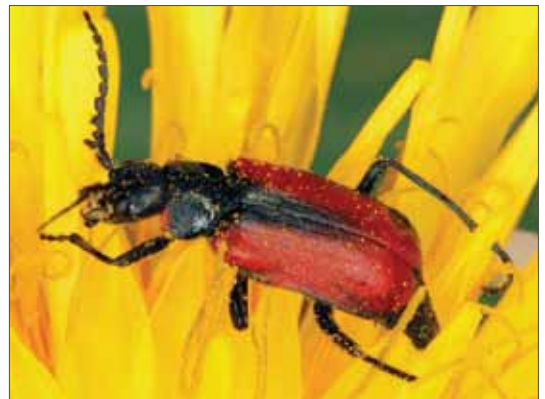
Malachius rubidus . Dobratsch (AT), 9.5.2013, Foto: S. Aurenhammer.

Aus den drei Familien wurden für Sachsen-Anhalt insgesamt 42 Arten nachgewiesen. Das entspricht 67 % der insgesamt 63 deutschen Arten (KÖHLER & KLAUSNITZER 1998). Von den 42 Arten Sachsen-Anhalts entfallen auf die Malachiidae 25 Arten (mit 14 Rote-Liste-Arten), auf die Melyridae 16 Arten (mit 10 Rote-Liste-Arten) und auf die Phloiophilidae eine Art (Rote-Liste-Art).