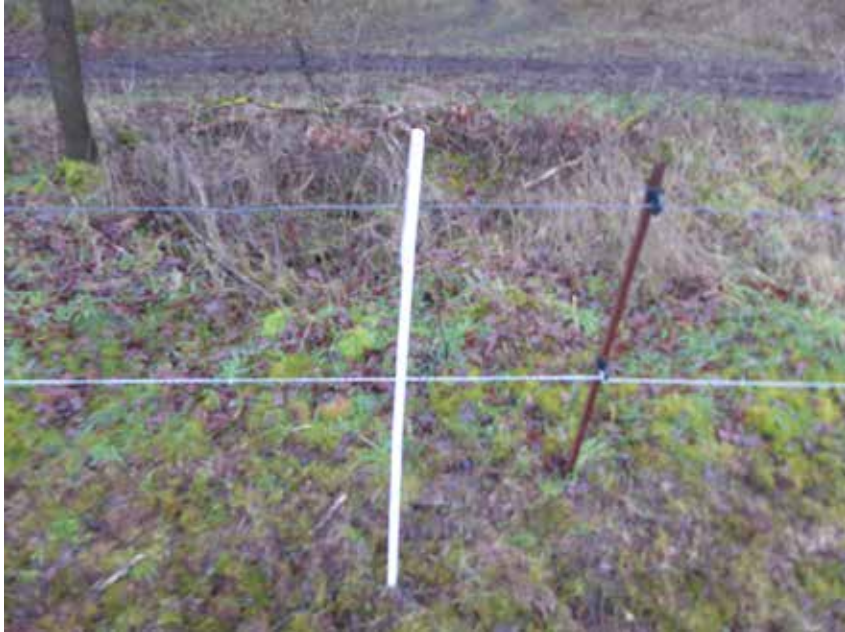
Übergriff auf Kalb bei zwei Litzen