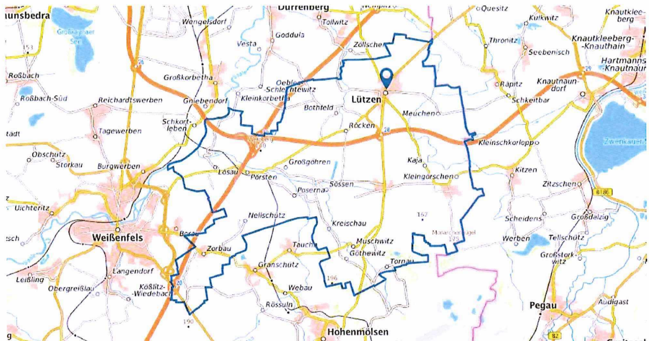
Abbildung 1 Übersicht Stadt Lützen 2

Die Stadt Lützen befindet sich im Süden von Sachsen-Anhalt im Burgenlandkreis. Derzeit leben in Lützen 8.584 Einwohner 1 . Das Gemeindegebiet umfasst eine Fläche von ca. 9.648 ha.